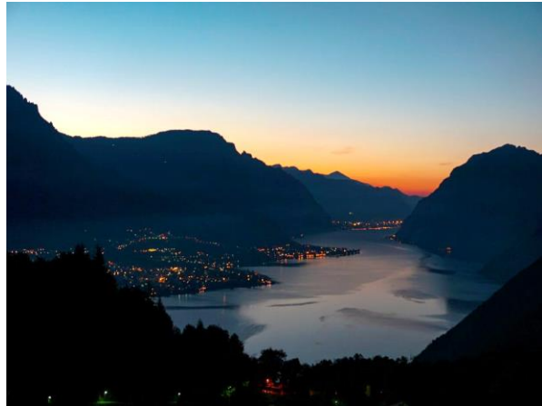
Abends am Comer See

Urlaub mit sportlicher Herausforderung in einer wunderschönen Landschaft: Wir freuen uns auf eine Tour mit euch durch die italienischen Alpen!