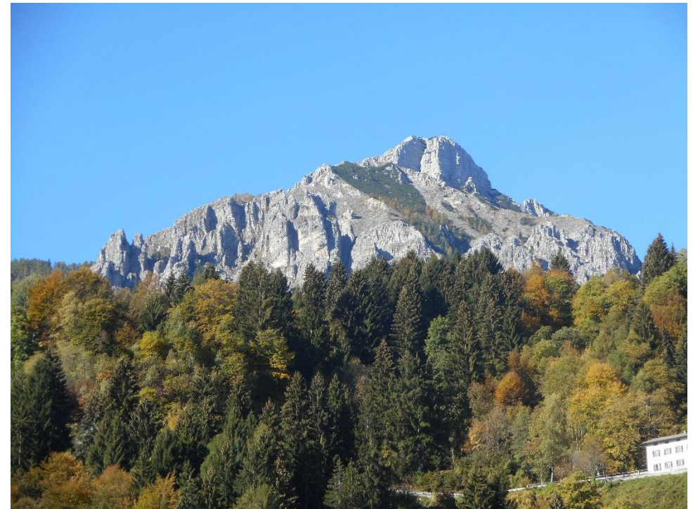
Monte Cimon bei Trento

Lust auf eine wunderschöne Alpentour mit dem Rennrad?